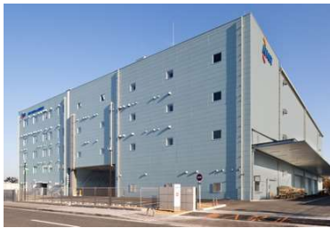
西鉄りんくう貨物センター

西鉄の航空貨物や保税に関する知識、JR 貨物については環境面や労働生産性に優位性のある貨物鉄道の輸送サービス、センコーの持つ鉄道利用運送事業者としてのコンテナ輸送についてのノウハウが、この輸送に結集しています。